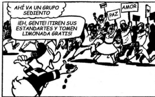
Imagen: Para leer al Pato Donald, 1972. Siglo XXI Editores, página 83.

Donald es la metáfora del pensamiento burgués que penetra insensiblemente en los niños a través de todos los canales de formación de su estructura mental (...) El modelo de la revista pasa a ser el modelo de sus relaciones inmediatas. 50